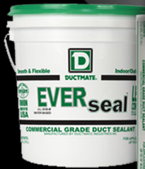
EVERseal™ BASE D'EAU