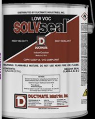
SOLVseal™ BASE DE SOLVANT