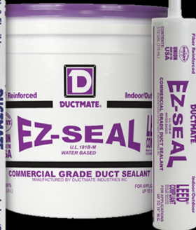
EZseal™ BASE D'EAU