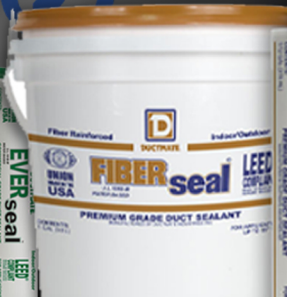
FIBERseal™ BASE D'EAU