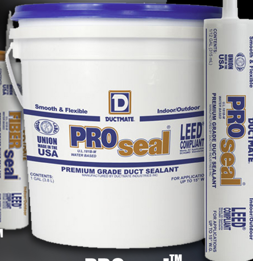
PROseal™ BASE D'EAU